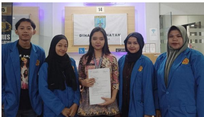
Gambar 3. Pengajuan perizinan PIRT

Proses pengunggahan dokumen perizinan ke sistem Online Single Submission (OSS) dibantu oleh pihak Dinas Kesehatan Kota Salatiga. Bantuan ini mencakup verifikasi dokumen yang telah disiapkan, pengisian data secara digital, serta memastikan bahwa seluruh persyaratan administratif telah terpenuhi.