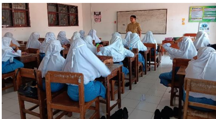
Gambar 3. Pendampingan kegiatan bersama dengan siswa SMKN 1 Kraksaan

Selanjutnya, sebelum melaksanakan kegiatan produksi siswa mencari serta menentukan ide usaha dan bersama dengan guru menyepakati produk apa yang akan diproduksi untuk kegiatan wirausaha. Selain pendampingan dari guru pihak yang terlibat baik itu dari mahasiswa, pembina koperasi bahkan guru PKK memberikan saran dan masukan terkait dengan ide usaha siswa. Pendampingan selama proses produksi merupakan tugas dan tanggung jawab guru pengajar yang juga dibantu oleh mahasiswa dan pembina koperasi sekolah. Selain mendampingi siswa melakukan kegiatan produksi, guru tersebut juga memiliki tanggung jawab untuk memberikan saran serta masukan kepada siswa terkait dengan produk yang dihasilkan baik dari segi rasa, kualitas produk, kemasan produk serta strategi pemasaran.