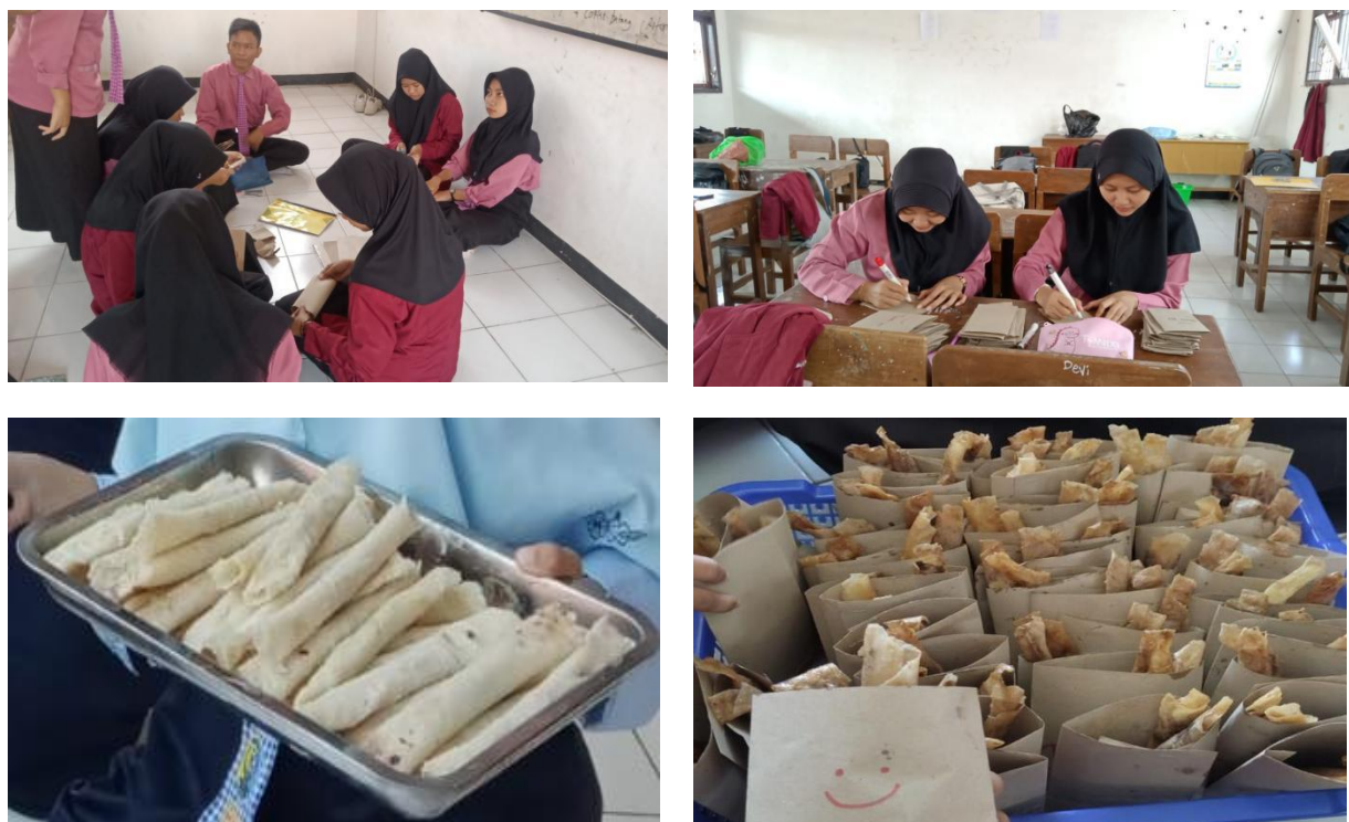
Gambar 4. siswa melaksanakan proses produksi

Selanjutnya dilakukan kegiatan pemasaran, siswa mempromosikan produk dan menciptakan komunikasi pelayanan pemasaran yang efektif. Adapun strategi pemasaran yang sudah berjalan salah satunya sistem “Titip” dimana dalam sistem ini siswa menitipkan hasil produk ke koperasi sekolah. Tidak hanya menitipkan saja, siswa dibimbing oleh tim pelayanan yang ada di koperasi sekolah untuk terlibat langsung dalam penjualan produk tersebut. Pemasaran dan strategi pemasaran dalam program entrepreneurship terbilang masih sederhana, namun cukup efektif, karena pemasaran yang dilakukan langsung kepada konsumen, dan konsumen kenal dengan orang-orang yang memasarkan produk. Karena hal tersebut konsumen lebih mudah menyampaikan kritik dan saran terhadap produk yang telah dibeli.