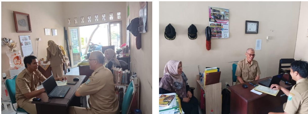
Gambar 2. Tahapan koordinasi dan Forum Group Discussion (FGD)

Selanjutnya, sebelum melaksanakan kegiatan produksi siswa mencari serta menentukan ide usaha dan bersama dengan guru menyepakati produk apa yang akan diproduksi untuk kegiatan wirausaha. Selain pendampingan dari guru pihak yang terlibat baik itu dari mahasiswa, pembina koperasi bahkan guru PKK memberikan saran dan masukan terkait dengan ide usaha siswa. Pendampingan selama proses produksi merupakan tugas dan tanggung jawab guru pengajar yang juga dibantu oleh mahasiswa dan pembina koperasi sekolah. Selain mendampingi siswa melakukan kegiatan produksi, guru tersebut juga memiliki tanggung jawab untuk memberikan saran serta masukan kepada siswa terkait dengan produk yang dihasilkan baik dari segi rasa, kualitas produk, kemasan produk serta strategi pemasaran.