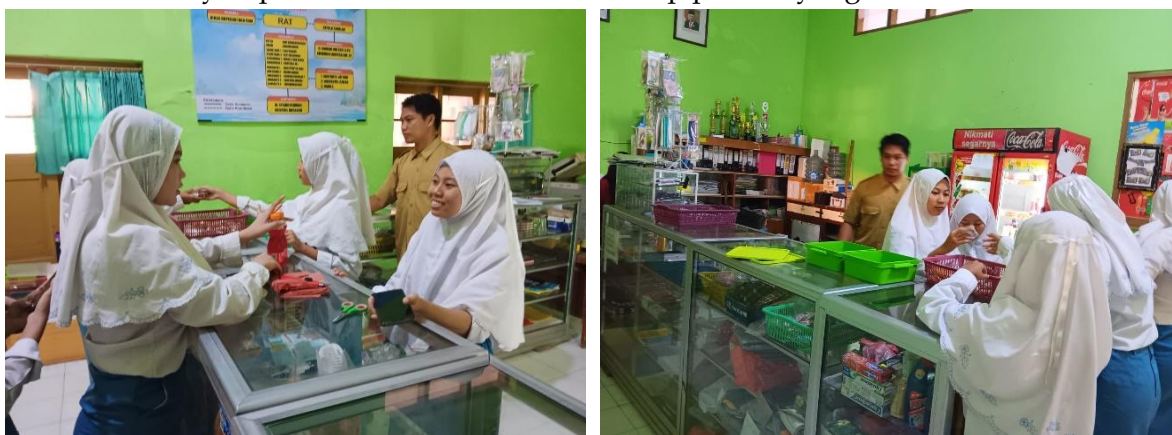
Gambar 5. Siswa melakukan pemasaran produk melalui koperasi sekolah

Selanjutnya dilakukan kegiatan pemasaran, siswa mempromosikan produk dan menciptakan komunikasi pelayanan pemasaran yang efektif. Adapun strategi pemasaran yang sudah berjalan salah satunya sistem “Titip” dimana dalam sistem ini siswa menitipkan hasil produk ke koperasi sekolah. Tidak hanya menitipkan saja, siswa dibimbing oleh tim pelayanan yang ada di koperasi sekolah untuk terlibat langsung dalam penjualan produk tersebut. Pemasaran dan strategi pemasaran dalam program entrepreneurship terbilang masih sederhana, namun cukup efektif, karena pemasaran yang dilakukan langsung kepada konsumen, dan konsumen kenal dengan orang-orang yang memasarkan produk. Karena hal tersebut konsumen lebih mudah menyampaikan kritik dan saran terhadap produk yang telah dibeli.