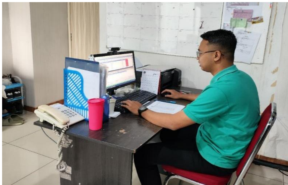
Gambar 3. Penyusunan Prosedur dan Alur Sistem AKuntansi Pendapatan

Selain itu, terjadi efisiensi dalam proses keuangan yang sangat terasa di lapangan. Sebelumnya, proses pencatatan pendapatan dan verifikasi keuangan memerlukan waktu yang cukup lama, namun setelah implementasi sistem yang baru, proses ini menjadi lebih cepat dan efisien. Sistem akuntansi yang baru memungkinkan staf untuk mengelola transaksi secara otomatis, yang pada gilirannya mengurangi beban kerja manual dan meningkatkan produktivitas. Penemuan ini selaras dengan penelitian Anwar, et.al. (2019), yang mengungkapkan bahwa digitalisasi dalam pengelolaan akuntansi hotel dapat mengurangi biaya operasional dan meningkatkan efisiensi waktu.