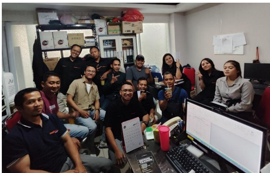
Gambar 4. Kegiatan Pelatihan dan Sosialisasi

Secara keseluruhan, hasil pengabdian ini menunjukkan bahwa penerapan teknologi yang tepat, pelatihan staf yang efektif, dan keterlibatan aktif manajemen dalam setiap tahapan implementasi berhasil meningkatkan efisiensi pengelolaan keuangan dan pengambilan keputusan manajerial di hotel tersebut. Sistem akuntansi yang lebih efisien dan transparan tidak hanya meningkatkan akurasi pencatatan pendapatan, tetapi juga memberikan dampak positif pada kinerja keseluruhan hotel. Dengan demikian, sistem yang telah diterapkan di Hotel Front One Budget Malang diharapkan dapat terus mendukung pengelolaan keuangan yang lebih baik dan pengambilan keputusan yang lebih berbasis data di masa depan.