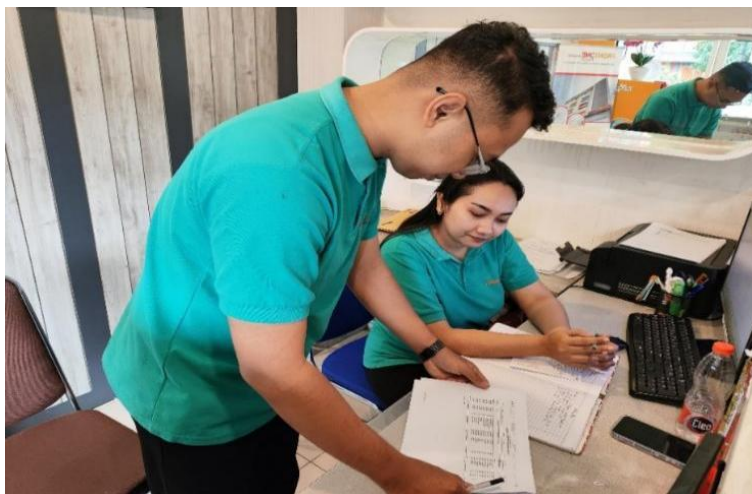
Gambar 2. Pengumpulan Informasi Sistem Pencatatan Pendapatan Hotel

Selanjutnya, setelah mengumpulkan informasi, prosedur dan alur sistem akuntansi pendapatan disusun untuk meningkatkan efektivitas dan efisiensi dalam pengelolaan pendapatan. Proses ini mencakup alur dari penerimaan reservasi hingga pelaporan keuangan yang melibatkan beberapa pihak seperti Front Office , Night Audit , Income Audit , dan Chief Accounting .