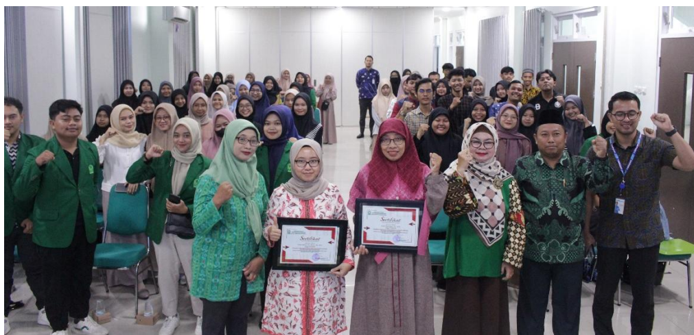
Gambar 4. Foto Bersama team dan peserta pelatihan

Lebih lanjut, evaluasi yang menunjukkan mayoritas mahasiswa merasa terbantu dan lebih percaya diri mengindikasikan keberhasilan pendekatan ini dalam memberikan motivasi intrinsik. Menurut Deci dan Ryan dalam teori Self-Determination , motivasi intrinsik sangat penting dalam meningkatkan kinerja akademik mahasiswa. Dengan membangun rasa percaya diri dan memberikan panduan yang jelas, pelatihan ini mendorong mahasiswa untuk lebih proaktif dan percaya diri dalam menyelesaikan skripsi.