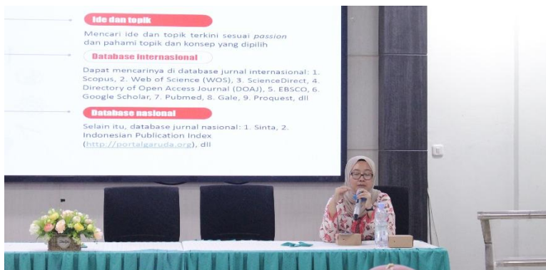
Gambar 2. Penyampaian materi

Setelah sesi ceramah, diadakan sesi tanya jawab dimana mahasiswa diberikan kesempatan untuk mengajukan pertanyaan seputar materi yang telah disampaikan. Diskusi ini sangat interaktif dan membantu mahasiswa memahami lebih dalam tentang tantangan dan strategi dalam penulisan skripsi. Pada siang harinya, pelatihan dilanjutkan dengan pemateri kedua, seorang praktisi akuntansi syariah yang berbicara mengenai penerapan prinsip-prinsip syariah dalam penelitian akuntansi. Materi ini penting untuk memastikan bahwa penelitian yang dilakukan sesuai dengan nilai-nilai syariah yang menjadi dasar dari program studi mereka. Pemateri menjelaskan berbagai metode pengumpulan data yang sesuai dengan prinsip syariah serta cara analisis data yang tepat.