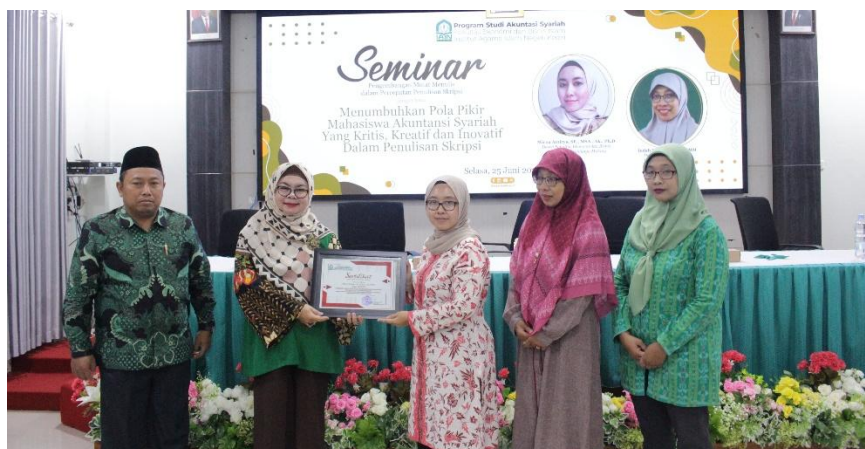
Gambar 3. Penyerahan cinderamata kepada pemateri

Evaluasi pelatihan dilakukan pada akhir pertemuan. Mahasiswa diminta mengisi kuesioner yang menilai aspek-aspek seperti pemahaman materi, kualitas penyampaian pemateri, dan manfaat pelatihan secara keseluruhan. Hasil evaluasi menunjukkan bahwa sebagian besar mahasiswa merasa terbantu dengan pelatihan ini. Mereka mengapresiasi materi yang disampaikan karena memberikan gambaran jelas tentang proses penulisan skripsi serta memberikan solusi praktis untuk mengatasi kesulitan yang mereka hadapi. Beberapa mahasiswa juga memberikan saran untuk peningkatan, seperti penambahan waktu untuk sesi diskusi dan praktik penulisan. Berdasarkan evaluasi ini, tim pengabdian masyarakat merencanakan tindak lanjut berupa bimbingan intensif bagi mahasiswa yang masih memerlukan bantuan dalam penulisan skripsi mereka, sehingga tujuan pelatihan untuk meningkatkan kemampuan dan kepercayaan diri mahasiswa dalam menyusun skripsi dapat tercapai dengan baik.