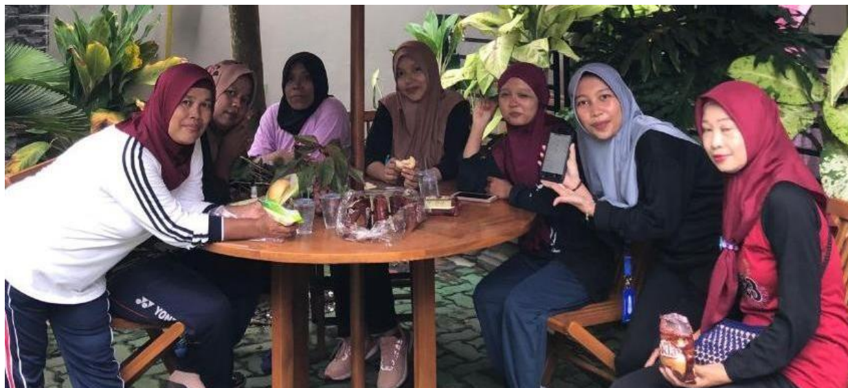
Gambar 2. Sosialisasi Pengenalan KitaBisa pada Ibu - Ibu di Desa Payakabung

Hasil dari kegiatan pengabdian ini adalah peningkatan literasi informasi dan efisiensi dalam pembayaran zakat di Desa Payakabung. Melalui pendekatan yang inklusif dan langsung kepada masyarakat, penggunaan aplikasi Kitabisa, dan koordinasi dengan Baznas, pembayaran zakat dapat dilakukan dengan lebih efisien, transparan, dan terpercaya. Ini merupakan langkah penting dalam meningkatkan pengelolaan zakat yang lebih baik di tingkat masyarakat desa.