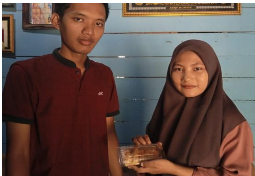
Gambar 1. Dokumentasi dengan pedagang

Menurut Peraturan Pemerintah Nomor 24 Tahun 2018 Pasal 25 Ayat (1) tentang Pelayanan Perizinan Berusaha Terintegrasi Secara Elektronik atau Online Single Submission (OSS) menyatakan Nomor Induk Berusaha (NIB) adalah suatu identitas yang diberikan kepada Pelaku Usaha dalam menjalankan usaha sesuai dengan bidang usahanya. Online Single Submission (OSS) adalah suatu sistem perizinan berusaha yang dibangun, dikembangkan dan dioperasikan oleh Pemerintah Pusat yang terintegrasi dan menjadi acuan utama dalam pelaksanaan berusaha. Keunggulan sistem OSS adalah memberikan system penyimpanan data yang terintegrasi dalam Nomor Induk Berusaha (NIB), sehingga mempunyai NIB merupakan hal penting bagi pemilik usaha. Pendaftaran perizinan berusaha NIB dengan menggunakan system OSS tidak dikenakan biaya atau gratis (Desvia & Tan, 2021).